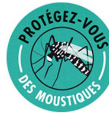
Tableau des répulsifs